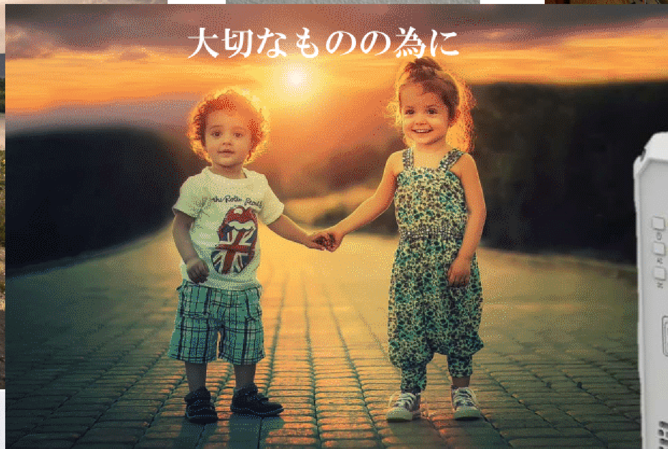
大切なものの為に