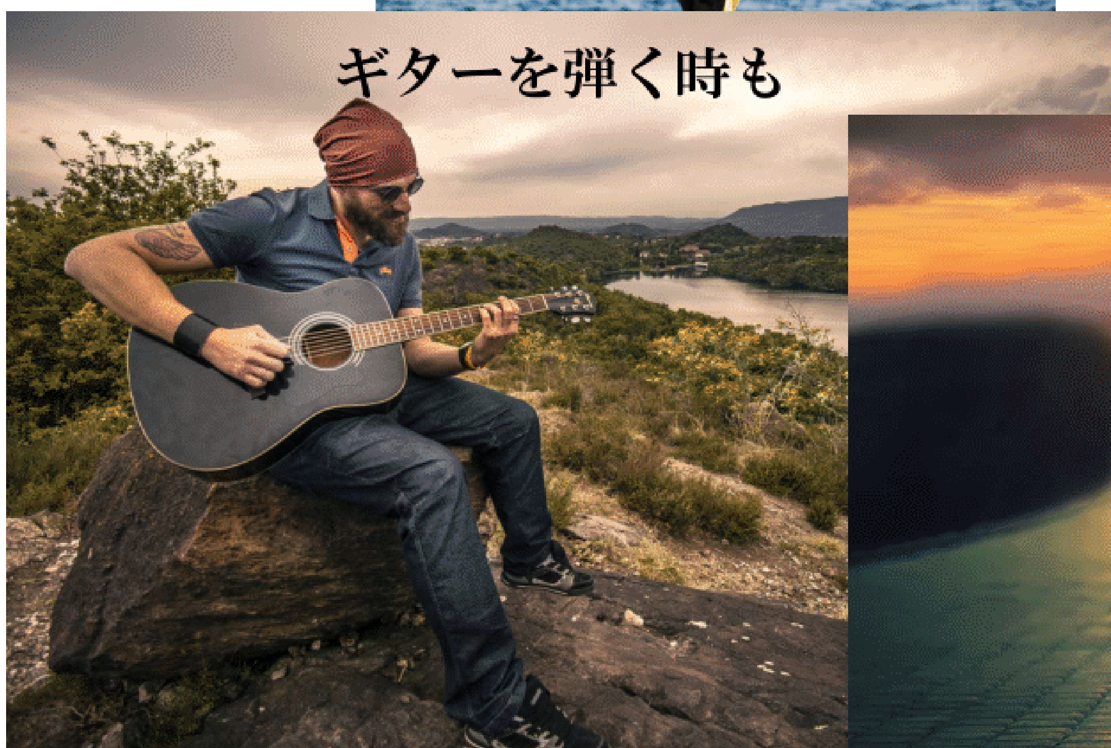
ギターを弾く時も